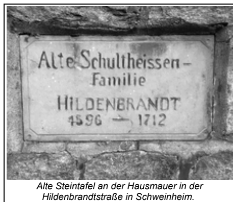
Alte Steintafel an der Hausmauer in der Hildenbrandtstraße in Schweinheim.