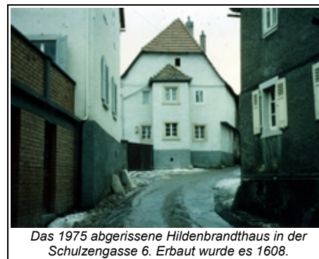
Das 1975 abgerissene Hildenbrandthaus in der Schulzengasse 6. Erbaut wurde es 1608.

1690 Hans Hildenbrandt. Nach Schweinfest, Schweinheim, hatten die Hildenbrandts-häuser einen sonst nicht üblichen Hofabschluss mit Mauern und einem großen Torbogen aus Stein. Als solche Häuser kommen in Betracht: das Anwesen Nr. 4 der Aschaffenburg Straße; der Torbogen alda wurde 1683 eingelegt; an Stelle des Hofes und der Nebengebäude wurde das jetzige Gebäude Nr. 2 im Jahre 1902 erbaut; ferner ein im Jahre 1893 eingelegtes Anwesen am Platze des neu errichteten Anwesens Nr. 18 der Marienstraße, dessen historisches Tor 1893 noch bestand; endlich das Anwesen Nr. 6 der Schulzengasse, dessen steinernen